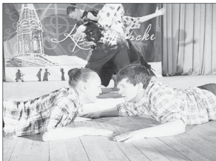
«Funny tAKT» – новые звезды «Зала фестивальной славы медиков»