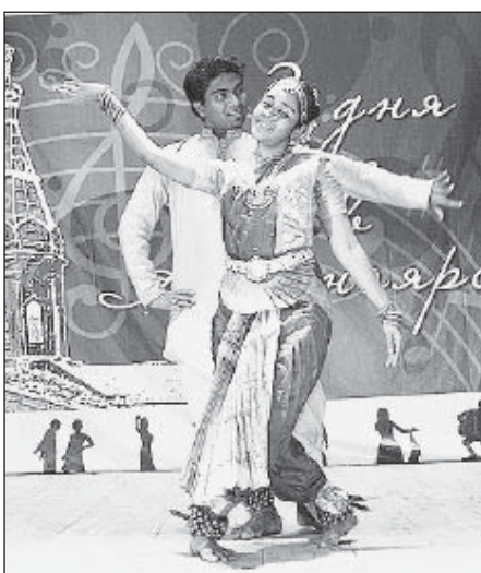
Индийские гости Саарика и Нандра