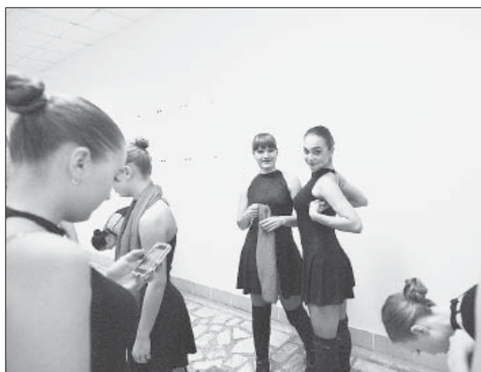
«Урфики» – любимцы университета