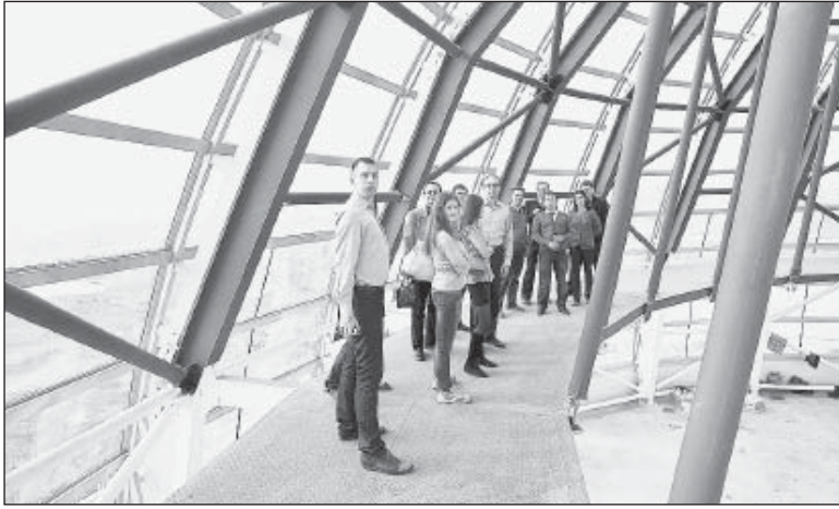
Под куполом КрасГМУ

А пока – еще на один этаж вверх по белой мраморной лестнице, останавливаясь у мемориальных досок и больших стендов, повествующих о продолжающейся грандиозной реконструкции, красноярских врачей и ученых, создававших славу КрасГМУ – одного из флагманов российского высшего медицинского образования. У этих портретов, расположенных после В.Ф.Войно-Ясенецкого в алфавитном порядке, задержались, всматриваясь в лица светил, внесших большой вклад в то или иное направление медицины. Взгляд автора этих строк невольно задержался на изображениях в центральной части стенда – один из первых ректоров Красноярско-