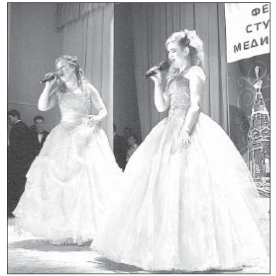
И снова чудо «Цветочного дуэта»