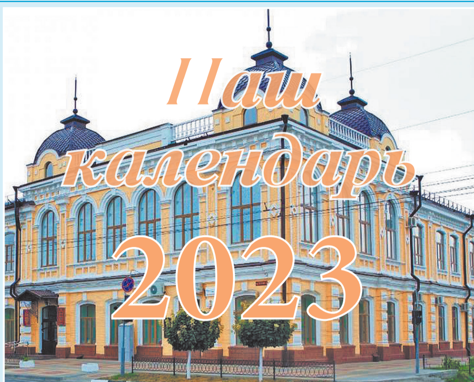
На снимке: Армавирский государственный педагогический университет.