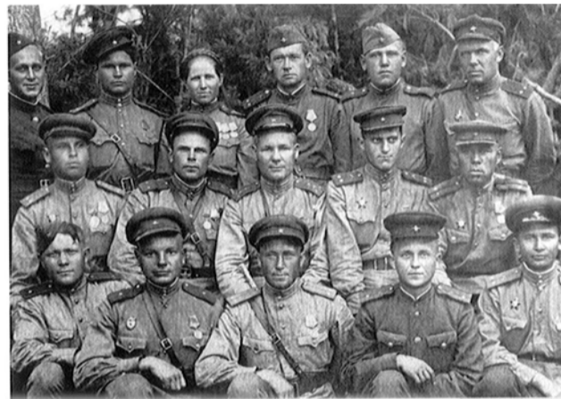
На обороте фотографии рукой отца написано: «Офицерский состав артиллеристов. 1944 г., июня 22 дня...»

В мире не было, нет и не будет человека, ум и воображение которого позволили бы ему охватить запредельный масштаб и безмерный трагизм Блокады, будь он дважды Данте или трижды Шекспир. Можно гениально описать ужасы загробного ада. Кто удостоверит подлинность воображаемого?..