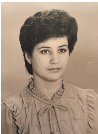
Выпускница НГМИ, 1986 год

Но не надо забывать о том, что многие дерматозы патогенетически связаны с заболеваниями внутренних органов и могут выступать маркерами эндокринопатий, патологии желудочно-кишечного тракта, онкологической патологии и т.д. Кроме того, состояние кожи влияет на эмоциональный статус человека. Поэтому очень важно разобраться с каждым больным индивидуально, назначить не только стандартную терапию, но и дать рекомендации, необходимые именно ему, с учетом его возраста, образа жизни, профессии, приверженностям в питании, психологического состояния.