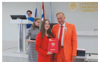
На фармацевтическом факультете в этом году семь отличников