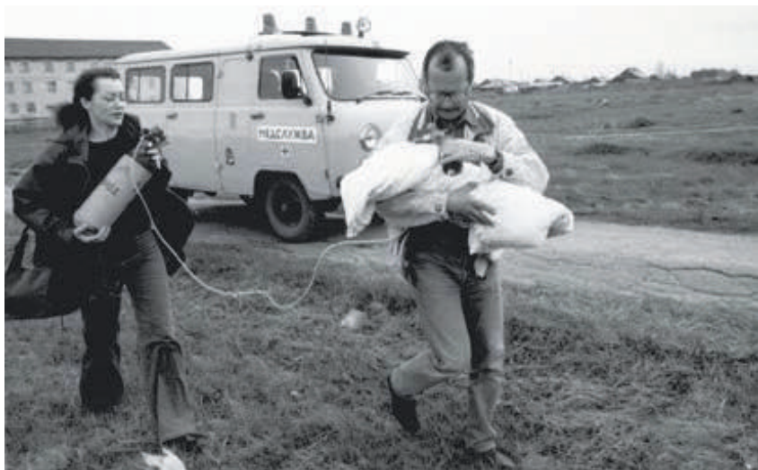
Транспортировка маленького пациента в областную больницу по линии санавиации

Материал из книги «Больница в лицах. ГНОКБ – 80 лет!»