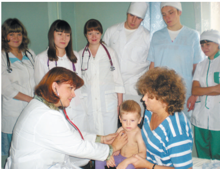
Занятия со студентами на клинической базе

– Наш факультет стоял у истоков олимпиадного движения. Пер-