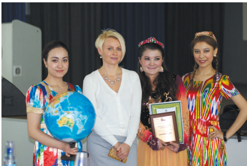
Со студентками НГМУ – участницами межвузовского фестиваля культуры CROSSROADS, 2016 год

Человек, который не путешествует, имеет, как правило, стереотипный взгляд на мир. Он живет, мыслит, соответственно и действует в рамках сформированной в постоянной культурной парадигме ментальности. Путешествия нас обогащают, даже если это поездки внутри страны. Мое увлечение путешествиями начиналось именно так, с поездок в другие регионы России. Когда появилась возможность, я стала открывать для себя другие страны. Когда я побывала в США и Японии, поняла, что мир просто безграничный. В своей речи я постоянно употребляю фразу: «На данный момент я вижу ситуацию так». То есть я всегда допускаю, что ситуация может измениться, мое мнение может измениться, и это абсолютно нормально. Когда мы на кафедре с коллегами спорим, я говорю: «Убедите меня! Если ваши доводы будут убедительными, я приму вашу позицию».