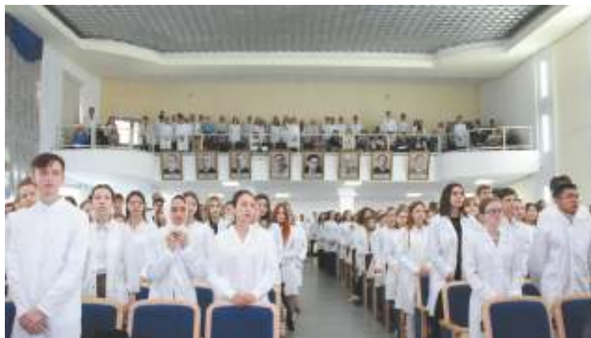
Торжественное обещание первокурсников дают студенты лечебного факультета

К словам поздравления присоединился министр К.В. Хальзов: «Вам повезло, потому что сегодня вы будете сразу приходить на практику в изменившиеся медицинские учреждения, которые на самом деле наполнены самым современным медицинским оборудованием, будете учиться в самых современных условиях. Параллельно с государственными медорганизациями