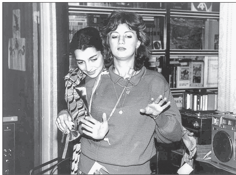
Сёстры были очень дружны