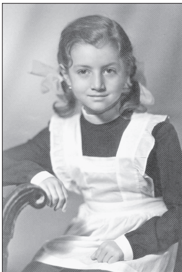
С детства в ней чувствовался характер