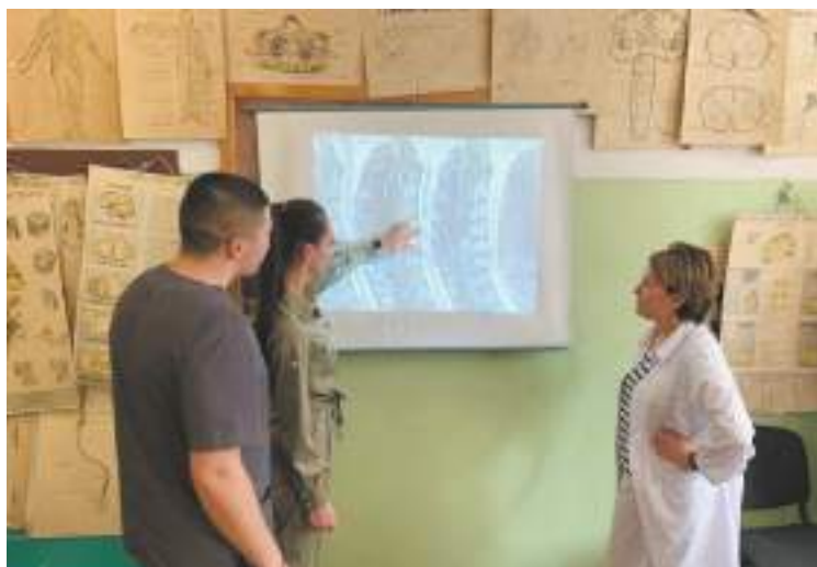
На занятиях со студентами