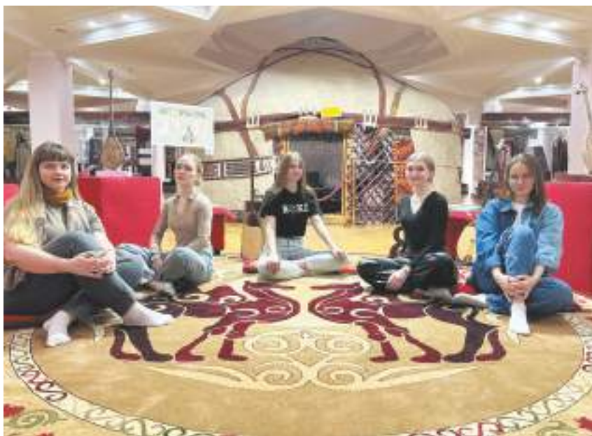
В Центральном государственном музее Республики Казахстан

Культурная программа была не менее насыщенной. Мы увидели такие достопримечательности, как Кок-Тобе, Медеу, Чимбулак, Алматинский зоопарк, Центральный государственный музей Республики Казахстан, а также посетили Казахский национальный театр драмы имени Мухтара Ауэзова, где шла премьера спектакля «Козы Корпеш – Баян Сулу» на казахском языке. Мы слушали спектакль в наушниках с синхронным переводом, это было очень необычно. Словом, поездка удалась, ни на секунду не пожалела о своем решении поехать в Алматы. Спасибо НГМУ за предоставленную возможность!