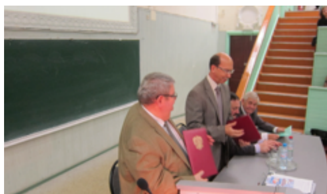
Фото 23, 24. Торжественный обмен экземплярами Договоров о двустороннем сотрудничестве между ВУЗами.