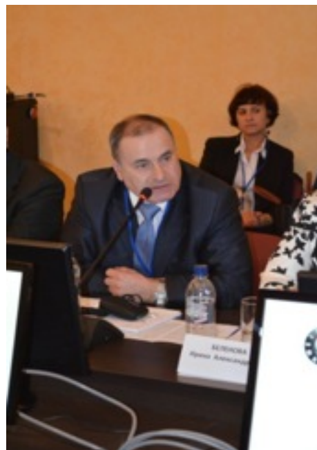
Фото 16. Дискуссия участников Совещания.

В завершении Совещания ведущие специалисты стоматологических факультетов ЦФО России обсудили проект Резолюции, в котором излагались основные решения, принятые в ходе обсуждений. Неравнодушное обсуждение участниками мероприятия основных задач реструктуризации образовательного процесса, по специальности «Стоматология», позволило сформировать Резолюцию Совещания.