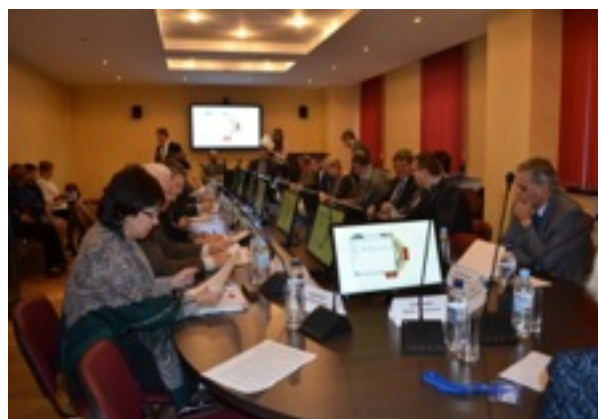
Фото 6, 7 Рабочие моменты Совещания деканов ЦФО России.

Поддержку мероприятия осуществляли официальные лица: от Минздрава России - начальник отдела послевузовского и дополнительного профессионального образования департамента медицинского образования и кадровой политики в здравоохранении министерства здравоохранения Российской