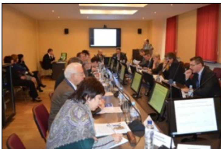
Фото 17. Работа над проектом Резолюции Совещания.

В завершении Совещания ведущие специалисты стоматологических факультетов ЦФО России обсудили проект Резолюции, в котором излагались основные решения, принятые в ходе обсуждений. Неравнодушное обсуждение участниками мероприятия основных задач реструктуризации образовательного процесса, по специальности «Стоматология», позволило сформировать Резолюцию Совещания.