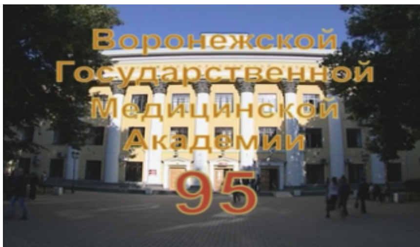
Фото1. Учебно-административный корпус ВГМА им. Н.Н. Бурденко.

12 ноября 2013 года исполнилось 95 лет со дня основания ВГМА им. Н.Н. Бурденко. Воронежская медицинская академия является одним из старейших вузов России. Он был организован еще в 1918 году в составе вновь созданного ВГУ, на базе личного состава медицинского факультета Юрьевского университета, эвакуированного в Воронеж.