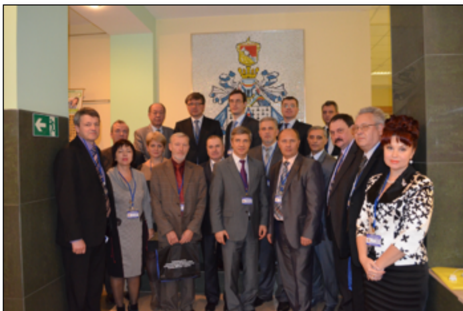
Фото18. Участники Совещания деканов стоматологических факультетов Вузов Центрального Федерального Округа России, 13 ноября 2013года (Воронеж).

Общим решением была принята Резолюция совещания деканов стоматологических факультетов ЦФО России «Первые итоги реализации федерального государственного стандарта по специальности «Стоматология». Проблемы и пути их решения».