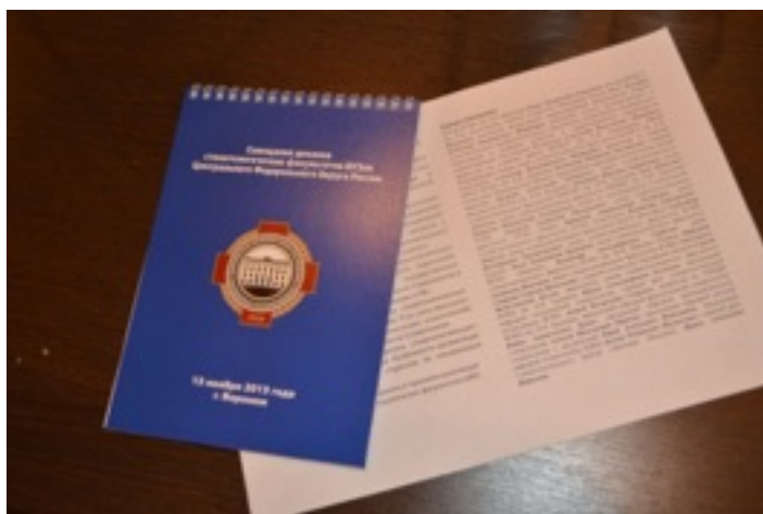
Фото 5. Программа Совещания деканов стоматологических факультетов ЦФО.

В числе юбилейных мероприятий, с целью повышения эффективности планового внедрения в работу ВУЗа Федерального государственного образовательного стандарта (ФГОС) и Федерального закона Российской Федерации «Об образовании в РФ», 13 ноября 2013г., впервые в России, организовано и проведено Совещание деканов стоматологических факультетов Вузов Центрального Федерального Округа (ЦФО) России.