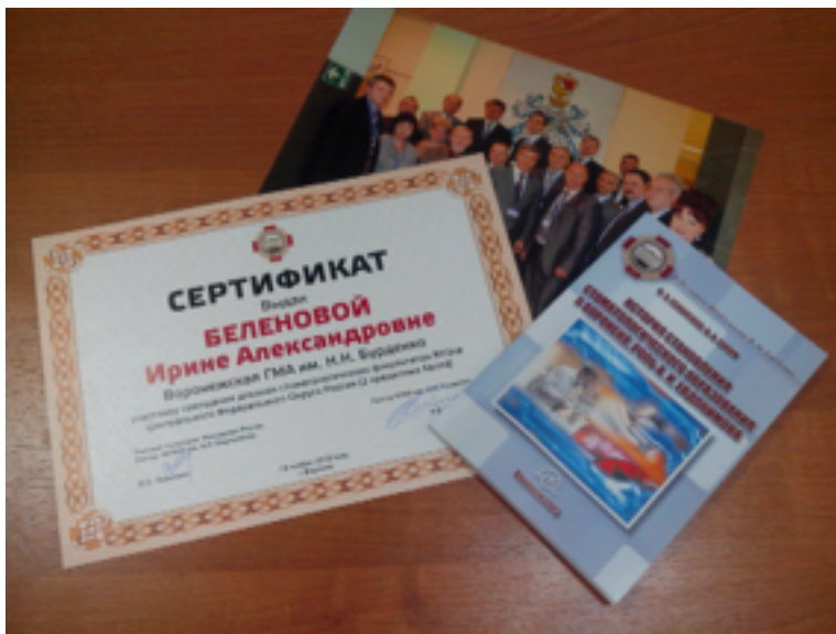
Фото 25. Сертификат участника Совещания и издание о жизнедеятельности профессора А.И. Евдокимова.