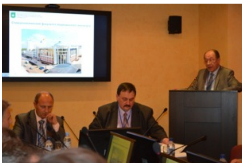
Фото 13. Доклад декана стоматологического факультета БелГУ