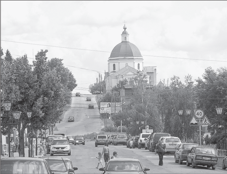
Главная улица города – Советская