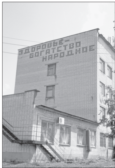
Один из корпусов ЦРБ

– Рассказать как мы живём? Мне кажется, сейчас опять начинается период подлинного возрождения здравоохранения. И цифры здесь могут наглядно подтвердить правоту моих слов. Посмотрите, в результате реализации