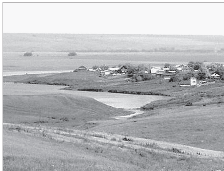
Эцкюль – дивный авыл у озёр

Приход гостя – обязательное чаепитие. На стол всякий раз выставляют кош-теле («птичий язык» – сладкий хворост), пироги с курагой и черносливом, конскую колбасу казы, сыр... Чак-чак едят редко – это всё-таки казанское блюдо.